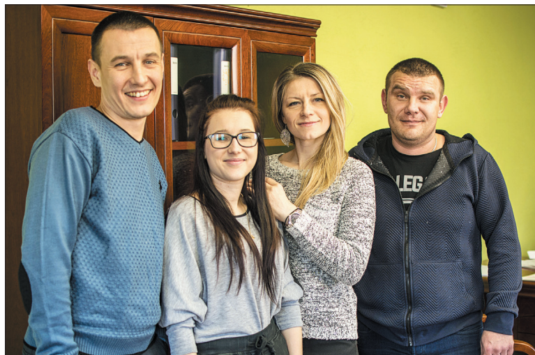
Pracownicy Centrum Pracy Tymczasowej Pajmon

Wodzisławska agencja zajmuje się obsługą rekrutacji stałej, pracy tymczasowej, użyczeniem pracowników z Ukrainy i Indii, a także delegowaniem pracowników do pracy w Czechach i Niemczech. Obsługuje korporacje, a także świadczy usługi dla średnich i małych przedsiębiorstw. Choć przedsiębiorstwo na mapie miasta funkcjonuje od zeszłego roku, to już zasługuje na miano najszybciej rozwijającej się firmy rekrutacyjnej. Agencji zaufały już setki osób poszukujących pracy, które znalazły zatrudnienie w interesujących je branżach. Aktualnie w ich bazie danych jest ponad pół tysiąca pracowników.